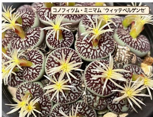
コノフィツム・ミニマム 'ウィッテベルゲンゼ'

コノフィツム属は1922年に設立され、間もなく日本に導入されました。以来、種間交配等による栽培品種も盛んに作出されるなど、100年近く小型多肉植物として親しまれてきました。しかし現在、かつての品種が入手困難となり、国内における品種名の混乱が起こっていることや、野生種の絶滅が危ぶまれることから2023年にCITES 附属書 III に指定されました。