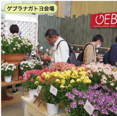
ゲブラナガトヨ会場