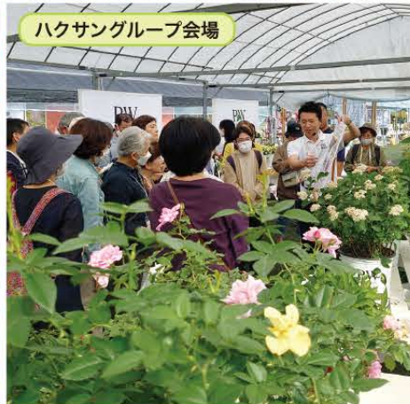
ハクサングループ会場