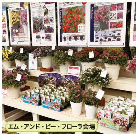
エム・アンド・ビー・フローラ会場