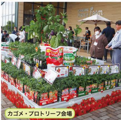
カゴメ・プロトリーフ会場