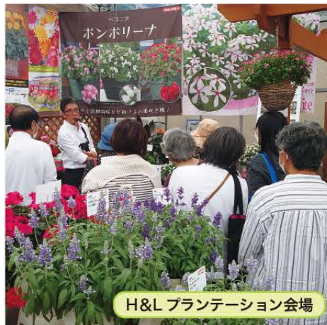
H&L プランテーション会場